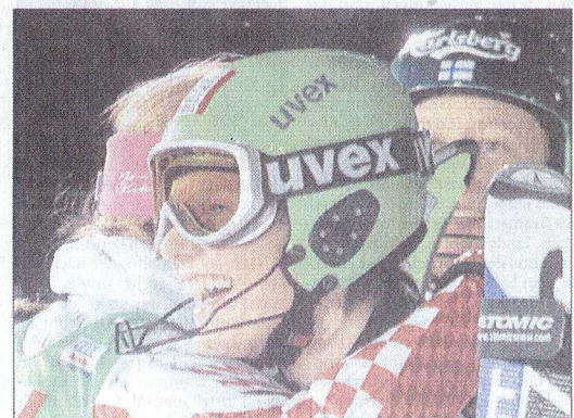
Marlies Schild lässt sich als Siegerin gerne von Janica Kostelic umarmen.